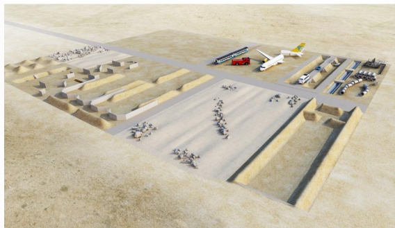
Návrh polygonu EOD/IOD včetně trhacích pracovišť a simulačních technických zařízení (vagony, letadlo...)