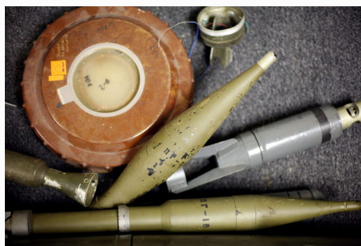
Výsledky práce v terénu