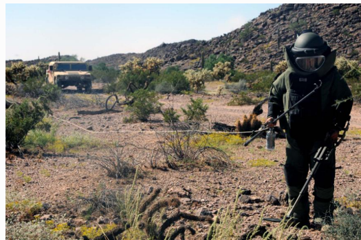
Pyrotechnik v ochranném obleku