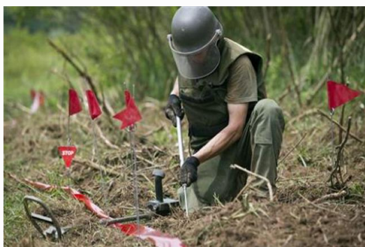
Pyrotechnik v terénu